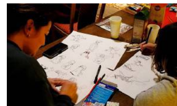
Unterschiedliche Nationen zeichneten zusammen.

gesamt gibt es jetzt 181 Plätze für Kinder vom Krippenalter bis zum sechsten Lebensjahr. „Mit dem zusätzlichen Angebot an Betreuungsplätzen für jede Altersgruppe unterstreichen wir, dass die Marktgemeinde ein kinder- und familienfreundlicher Ort ist, in dem junge Familien eine Perspektive haben“, betont der Bürgermeister stolz.