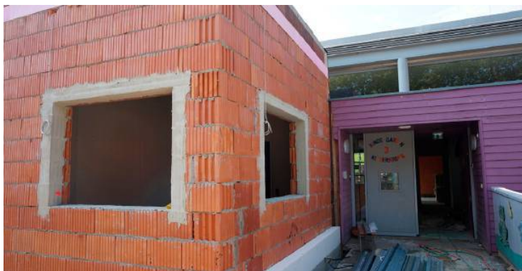
Ein knappes halbes Jahr dauerten die Bauarbeiten beziehungsweise der Zubau für den Kindergarten III in Gratkorn an.

Wenn sich immer mehr Jungfamilien in einer Gemeinde wohlfühlen, ist diese vor die Herausforderung gestellt, dem Gemeindegewachstum auch entsprechende Angebote zu bieten. Rund 2,7 Millionen Euro investierte Gratkorn daher im Vorjahr in den Ausbau des Kinderbetreuungsangebotes. Nach der Fertigstellung der Umbauten beziehungsweise der Erweiterung im Kindergarten II kommt die freudige Nachricht, dass auch der Zubau des Kindergartens III um eine Kindergarten-Gruppe nun fix abgeschlossen ist.