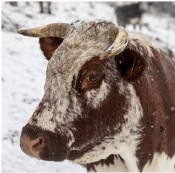
Die Pustertaler Sprinzen werden am Hof gezüchtet.